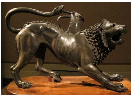
Chimère à deux têtes d'Arezzo, bronze, vers - 400.

Au mois de septembre, nous quitterons les rivages de la Grèce antique pour ceux de l'Italie ancienne ; après quelques éléments sur les cultures de la fin de la préhistoire dans la péninsule, nous découvrirons une des plus étranges civilisations de la Méditerranée : peuple d'origine incertaine, dont la culture mêle des traits orientaux et d'autres plus liés aux civilisations italiotes pré-romaines, les Thyrrhéniens (θυρρῆνοι) multiplie les caractéristiques surprenantes : liens et confits tant avec les Grecs d'Italie du Sud et de Sicile qu'avec les Poènes (Carthaginois / Phéniciens) de la côte d'Afrique du Nord, pratiques funéraires très spécifiques, développement des savoir-faire d'ingénieurs, et sens du portait identifiable... Les Etrusques sont entrés dans l'histoire de l'art et de la culture avec brio, ils en ressortiront discrètement avec leur assimilation puis absorption par la toute-puissante ROMA.