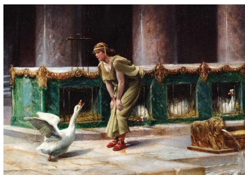
Henri-Paul Motte, Les Oies du Capitole , 1889

Après une présentation générale de l'histoire de Rome (périodes républicaine et impériale), et des caractéristiques générales de l'art romain et de la complexité de sa perception, entre les traits dus au « génie » propre de la civilisation romaine et les multiples accents engendrés par la multiplicité des peuples, cultures et civilisations qui se sont frottés à la Pax romana, nous entamerons au début 2022 un parcours dans l'histoire de l'art romain.