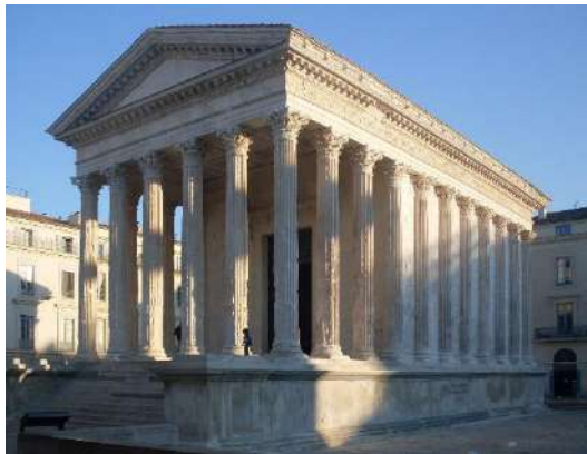
La Maison Carrée, à Nîmes (1er siècle)

Pendant les deux derniers siècles avant le début de notre ère, Rome est désormais consolidée dans sa domination de la Méditerranée (par ses victoires sur les Carthaginois et les Grecs notamment), mais la montée en puissance des chefs de guerre, à la tête de légions dorénavant professionnalisées, remet en cause en fonctionnement traditionnel de la Res Publica romaine et de son équilibre subtil des pouvoirs.