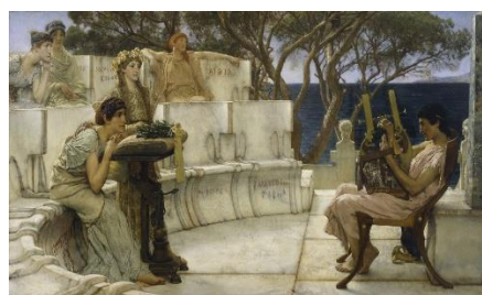
Lawrence Alma-Tadema, Sappho et Alcée, 1881

Inscription auprès de Monique Maréchal : 0471/57.52.82.