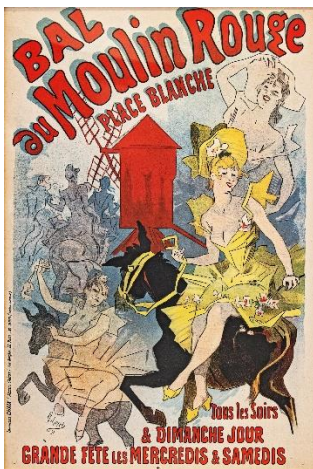
Jules Chéret, Bal du Moulin Rouge, 1889.

Inscription auprès de Monique Maréchal : 0471/57.52.82.