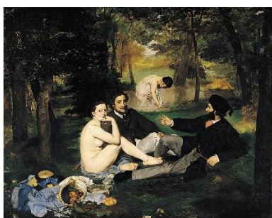
Edouard Manet, Le Déjeuner sur l'herbe, 1863

0471/57.52.82. Paiement : 6,50€/séance/personne.